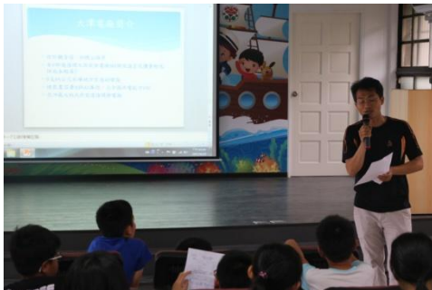
說明:介紹大潭電廠