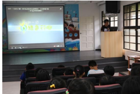
說明:節能減碳之重要