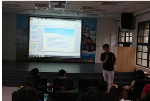
說明:介紹火力發電