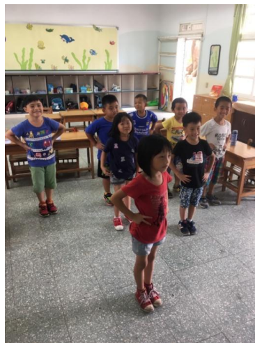
地震安全兒歌帶動唱