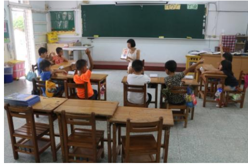
「地震了！這個時候該怎麼辦？」繪 本分享