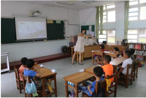
觀看「日本 311 地震」教學影片