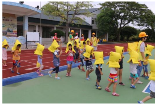
學生避難疏散演練