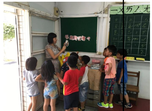
緊急避難包應放入何種物品？手搖式手電筒、收音機、警笛三合一。