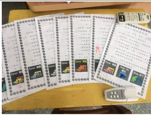
防災小尖兵學習單