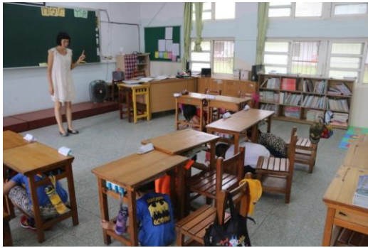
學生實作「趴下、掩護、穩住」動作