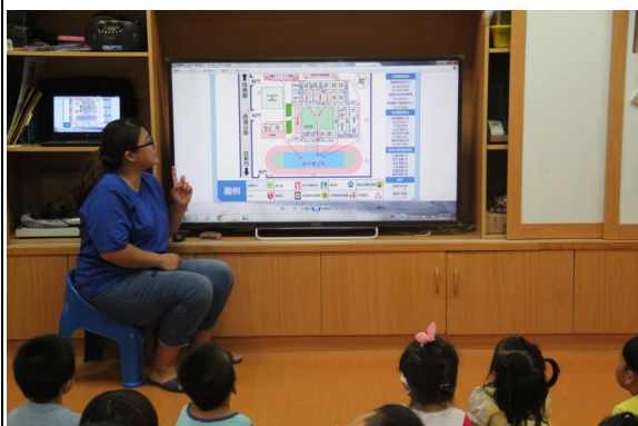
教學過程照片：活動 3「尋找校園防災地圖」