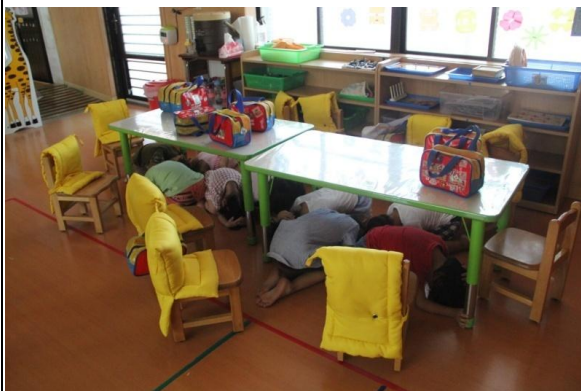
教學過程照片：活動 2「地震來了」