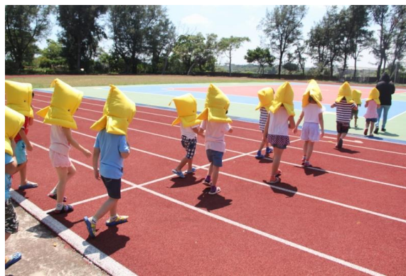
教學過程照片：活動 2「地震來了」