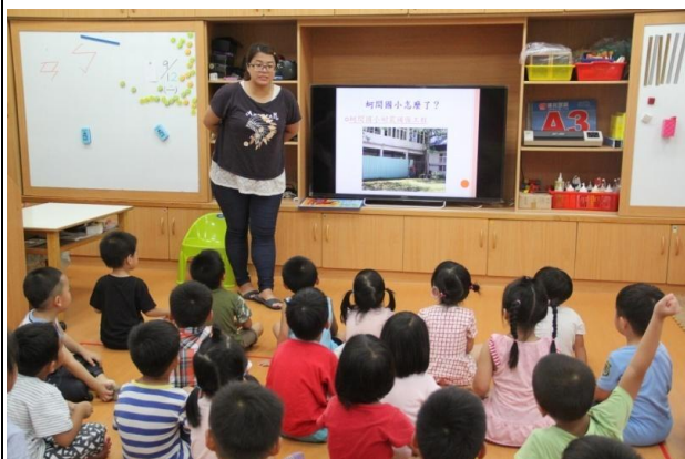
教學過程照片：活動 1「我的學校不一樣」