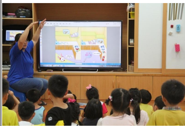
教學過程照片：活動 2「地震來了」