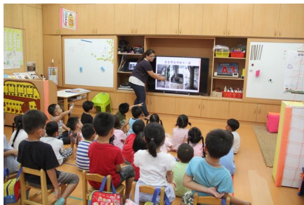
教學過程照片：活動 1「我的學校不一樣」