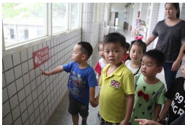
教學過程照片：活動 3「尋找校園防災地圖」