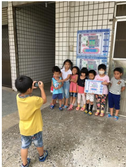
教學過程照片：活動 3「尋找校園防災地圖」