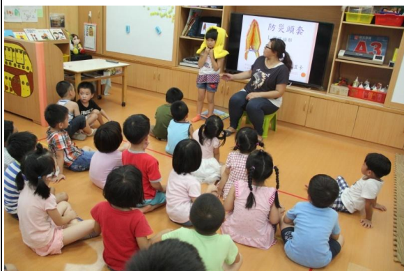
教學過程照片：活動 2「地震來了」