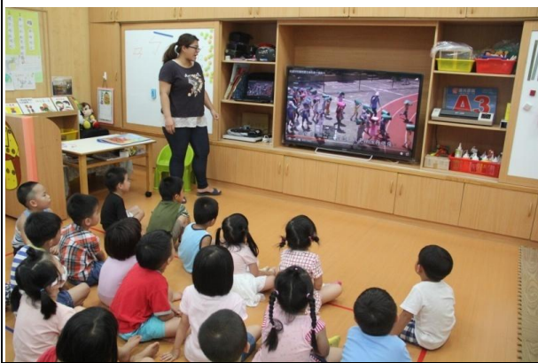
教學過程照片：活動 2「地震來了」