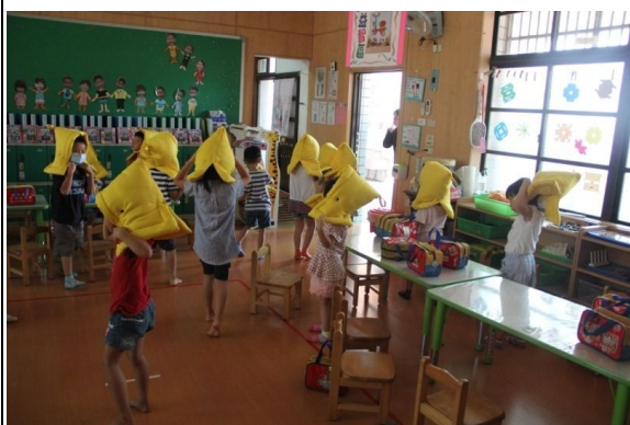
教學過程照片：活動 2「地震來了」