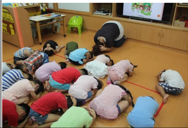
教學過程照片：活動 2「地震來了」