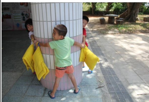
教學過程照片：活動 1「我的學校不一樣」