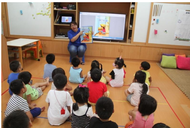
教學過程照片：活動 2「地震來了」