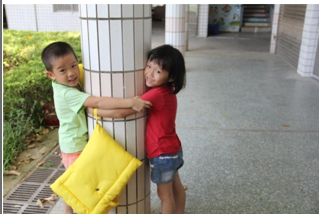
教學過程照片：活動 1「我的學校不一樣」