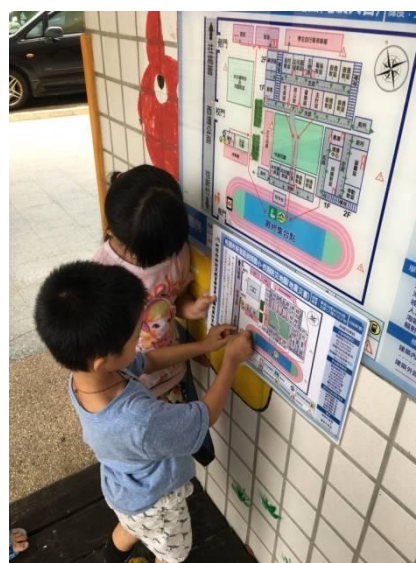
教學過程照片：活動 3「尋找校園防災地圖」